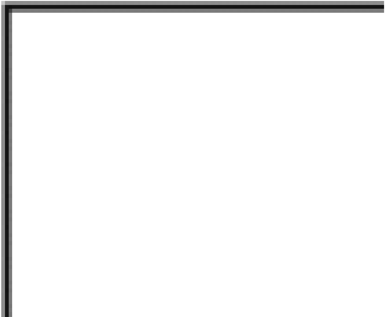
Tabla 1. Clasificación de las Aeronaves

Las aeronaves extranjeras de aviación general que hayan de permanecer en el país hasta por quince (15) días, remitirán a la Dirección de Servicios a la Navegación Aérea, con la solicitud de ingreso y permanencia, copia del correspondiente certificado de seguro, el cual además deberá permanecer a bordo.